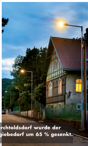
In Perchtoldsdorf wurde der Energiebedarf um 65 % gesenkt.

teilzunehmen“. Mit den in Perchtoldsdorf installierten Lösungen konnte der Strombedarf für die Straßenbeleuchtung um 65 % gesenkt werden. ■