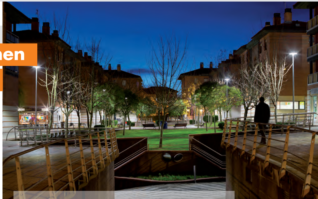
In Txorierri konnte der Energieverbrauch um 59 % gesenkt werden.

Der Vertrag mit dem Kommunalverband Txorierri bei Bilbao umfasst 9128 Lichtpunkte ausgehend von 358 Schaltschränken. Zum Vertragsumfang in Höhe von 8,5 Mio. € mit 1,5 Mio. € Anfangsinvestition gehört die komplette Stadtbeleuchtung mit bezifferten Leistungsvorgaben. Die Partnerschaft mit der Kommunalverwaltung hat eine Dauer von 10 Jahren: sie reicht von der